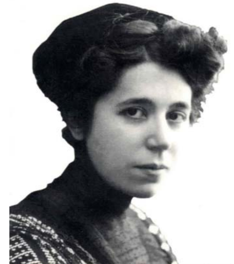
María de la O Lejárraga (1874 – 1974)